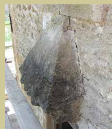
Καταχύστρα πριν και μετά τις εργασίες αποκατάστασης A murder-hole before and after restoration