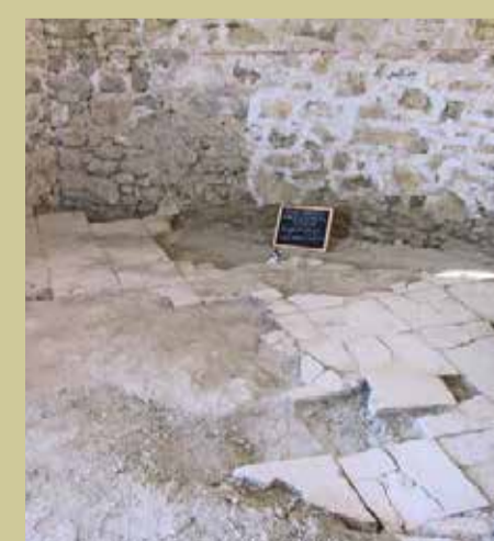
Το δάπεδο της δεύτερης στάθμης πριν και μετά τις εργασίες αποκατάστασης The floor of the second level before and after restoration