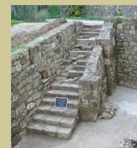
Εξωτερική κλίμακα του αλλείου χώρου του Πύργου πριν και μετά τις εργασίες αποκατάστασης The staircase to the courtyard before and after restoration