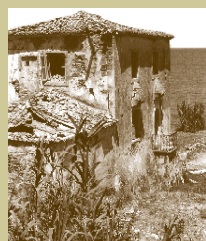
Ο Πύργος πριν από την έναρξη των εργασιών και κατά τη διάρκεια των εργασιών αποκατάστασης The tower before the beginning of restoration works and at the beginning of works

The Domeneghini Tower restoration project included works of masonry consolidation, roof repair, enhancement of the building and its surroundings and conservation of the Venetian fountain, as well as functional restoration of its interior. Upon completion of the project, the restored monument, which is a rare example of secular architecture in the period of Venetocracy, is also going to fulfill the purpose of a venue to host temporary exhibitions and cultural events.