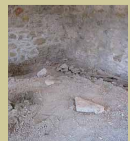
Η δεύτερη στάθμη του Πύργου πριν και μετά τις εργασίες αποκατάστασης The second level of the Tower before and after restoration